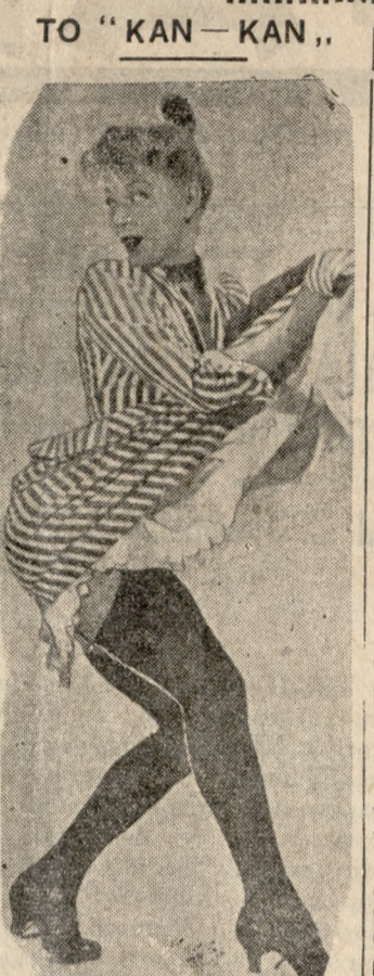
Κάθε Άμερικανός νγαρίζει δύο τούλάχιστον γαλλικός λέξεις, «Παρί» και «Κάν-Κάν».

ΠΛΟΥΝΤΑΙ εις Καστέλλι Πεδιάδος 90 πρόβατα τής ζωής με μέρος εκκοιλίας πληρωμής. Τιμή λογική με άξόχρεων έγγυητην και άνοσηστήν. Ο παλιτής Δημ. Προσώτακης. 1-20