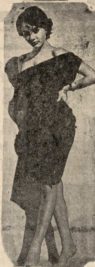
Αυτό το αγριόκοριτσο, είναι μια μικρή Πορζιάννα, που έχει κατακτήσει κυριολεκτικώς τους κοσμικούς κύκλους της Κωνσταντινής...

Φέρετρα διάφορα Τιμολογία. ΓΕΩΡ. ΧΑΡ. ΒΙΔΑΚΗ 'Οδός Μονής Απεραντων, Έναντι Υγιειν. Κέντρου.