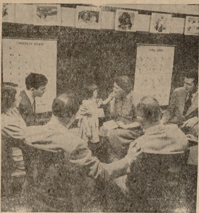
Μαθητευόμενοι, παρακολουθούν τον τρόπον διδασκαλίας των κοφών εις τὸ Γκαλοντέτ Κόλετζ, τοῦ Ίνστιτούτου Κοφῶν Κολούμπια. Εἰς τὴν φωτογραφία φαίνεται ἕνα θετικὸν παιδί κοφῶν.