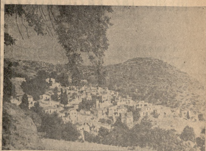
Τό χωρίον ΡΟΓΙΑ Μελεβυζίου

Άλλά ως πλέον άποδεικνύεται, εκ των πολλών ένδειξεων που έχομε μέχρι σήμερα, ή λέξη ντροπή, φαίνεται ότι είναι τόσο συνηθισμένη να άκούγεται, ώστε να μη φο-