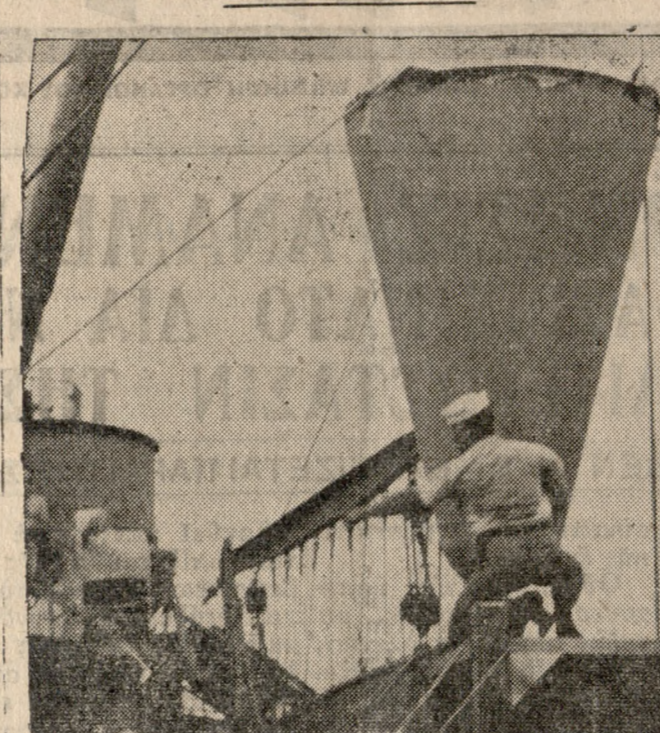
Ναῦται ναυαγοσώστικοῦ τοῦ Ἀμερικανικοῦ Ναυτικοῦ ἀνασῶν τὸν κῆνον πυραύλου «Ζεῦς» ἀπὸ τὸν Ἀτλαντικὸν Ὀκεανὸν εἰς ἀπόστασιν ἀπέχουσαν περὶ τὰ 1.500 μίλια ἀπὸ τοῦ χώρου ἐκτοξεύσεώς του εἰς τὸ Ἀκρωτήριον Κανάβερλ τῆς Φλωρίδας. Ὄβη, κατεβίβηθη τὸ πρῶτον ὅτι εἶναι δυνατὴ ἡ ἐπιτυχὴ ἐπάνω δος μεγάλου μεγέθους κῆνον, διαστάσεως τοῦ ὁποῖου εἰς 0,10 μ. ἐπιτυχῶς ἐπανεκλήθη τὸν παρολθόντα Ἀδύουτον.