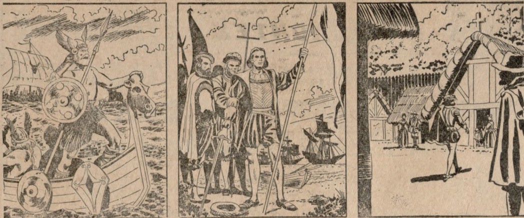
ΧΡΟΝΟΛΟΓΙΚΗ ΑΡΧΗ ΤΗΣ ΑΜ'ΡΚΑΝΙΚΗΣ ΙΣΤΟΡΙΑΣ