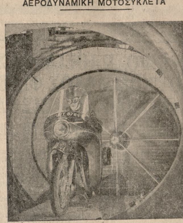
ΑΕΡΟΔΥΝΑΜΙΚΗ ΜΟΤΟΣΥΚΛΕΤΑ Εἰς τὴν παροῦσαν ἔκθεσιν Ἀυτοκινήτων εἰς τὸ Ἔργλ Κόρτ τοῦ Λονδίνου ἐπεδείχθησαν μετὰ ἄλλων ἀεροδυναμικὰ μοτοσυκλέτα μετὰ πλαστικὸν σκελετὸν ἀπὸ ἐνισχυμένον γυῶν. Ἡ ἑσπερίδα Μπρίστολ κατεσκεύασε μοτοσυκλέτα Ρόγιαλ Ἐνφιλντ 500 κυβ. ἐκ. καὶ 250 κυβ. ἐκάτ. ἕνα μοντέλο δὲ τῆς πρώτης εἰκονίζεται ἀνατὼρῶ ἐξερχόμενον ἀπὸ σπράγγα δοκιμῆς.

ΜΕ ΛΙΓΕΣ ΓΡΑΜΜΕΣ Ζωηροτάτη ὑπέροξε ἡ κίνησις τῶν προσκυνητῶν χθὲς εἰς τοὺς διαφόρους πανηγυρίζοντας ναοὺς καὶ ἰδιαιτέρως εἰς τὸν Ἅγιον Νικόλαον Ἀλικαρνασσοῦ.