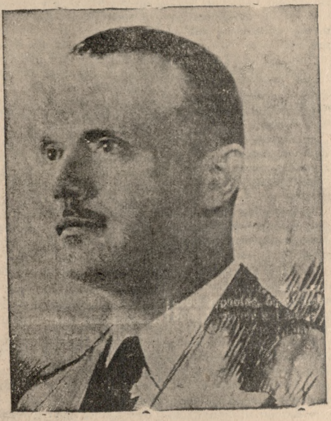
Ο κ. ΣΟΦ. ΒΕΝΙΖΕΛΟΣ

Αθηναι 19. (Τηλεφωνικώς) Τήν 11 π.μ. συνήλθεν η Κοινοβουλευτική ομάδα του Κόμματος των Φιλελευθέρων υπό την προεδρίαν του προσωρινού άρχηγού κ. Α. Γόντικα. Κάτόπιν όμοφώνου άποφάσεως τής Κοιν. ομάδος διεγράφησαν του Κόμματος οι βουλευται κ. κ. Γιαννόπουλος, Κοκκιένης και 'Εξάρχος οιτινες είχαν καταθέσει χθές εις το Προεδρείον της Βουλής δήλωσιν ότι διαχωρίζουν τας εϋθύνων, θεωρηθέντες ότι έθεσαν εαυτούς έντός του Κόμματος δια τας ενεργείας των τούτων. Κατόπιν προτάσεως του βουλευτου Εϋδοί-ας κ. 'Αρβαντακή η Κοινοβουλευτική ομάδα μετέβη την 6 μ.μ. εις την οίκίαν του κ. Σοφ. Βενιζέλου εξ όνόματος δε αυτής ο κ. Α. Γόντικας παρεκάλεσε τον κ. Σοφ. Βενιζέλον όπως ένψει των κρίσιμων ένθικων περιστάσεων, αναθεωρήσῃ την άπόφασιν του και αναλάβῃ άρξίως την άρχηγίαν του Κόμματος Φιλελευθέρων το όποιον προώρσται να διαδραματίσῃ σημαντικόν ρόλον εις την πολιτικὴν ζωὴν του τόπου. Ο κ. Βενιζέλος συγκεκριμένως από τας ένδειξι-ας των βουλευτων του Κόμματος ένδηλωσεν ότι παρά την μέχρι άπόφασιν του, είναι άποχρεωμένος να θεωρήσῃ εαυτὸν επιστρατευμένον και να αναλάβῃ την ήγείαν του Κόμματος Φιλελευθέρων. Οι βουλευται ένδέχθησαν την δήλωσιν του κ. Βενιζέλου με ζωηράς ένδηλώσεις. 'Υπό του κ. Βενιζέλου άπεστάλη άπόψε εις τόν Προεδρον της Βουλής η κάτωθι δήλωσις. α' Αξ. Κύριε Πρόεδρε, 'Υπέικων εις επίμονον έκκλησιν τής κοιν-