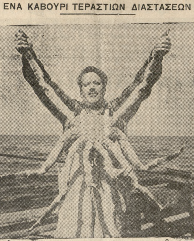
Στήν “Άλάσκα, ή όποια, στις 3 παρθένοτες Ίανουαρίου άνακηρύχθηκε ή 49η Πολιτεία τών ΗΠΑ. ή άλκία άποτελεί τήν κυριώτερη βιομηχανία. Αυτό τό καθόρι-γίνας είναι άντιπροσωπευτικός τύπος τών θαλασσιών είδών που άίώνονται στον Κόλπο της Άλάσκα και τήν Βρίγγιο Θάλασσα.