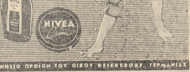
ΓΝΗΣΙΟ ΠΡΟΪΟΝ ΤΟΥ ΟΙΚΟΥ BEIERSDORF, ΓΕΡΜΑΝΙΑΣ

'Η NIVEA τρέφει τό δέρμα και τού δίνει τό απαραίτητο ύγρο για την όμορφιά του.