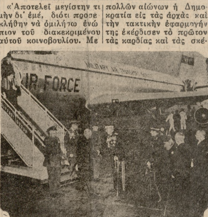
ΑΠΟ ΤΗΝ ΥΠΟΔΟΧΗΝ ΤΟΥ ΔΙΖΕΝΧΑΟΥΕΡ

ΑΘΗΝΑΙ 15.— 'Ολί-γον μετά τήν 10ην πρω-ίην ο Πρόεδρος 'Αί-ζενχάουερ συνοδευόμενος υπό τού πρωθυπουργού κ. Καραμανλή μετέβη εις τήν Βουλήν, γενόμενος δεκτός εις τή προύπαι-α των παλαιών ανακτόρων υπό τού Προέδρου τής Βουλής κ. Ροδοπούλου και τού Προεδρείου τού Σώματος. 'Ακολούθως ο 'Αμερ-ικανός Πρόεδρος εί-ηλ-θεν εις τήν αίθουσαν τών συνεδριάσεων υπό τή ζωηρά και παραετα-μένα χειροκροτήματα τών βουλευτών εκ όλης τής αίθουσης καί τών θεω-ρειών. 'Ο Πρόεδρος 'Αίζενχά-ουερ έν συνεχεία κατέλα-βεν τήν Προεδρικήν έδραν χών δεξιά τών τόν κ. Καραμανλή και άριστερά τού τόν κ. Ροδοπούλου.