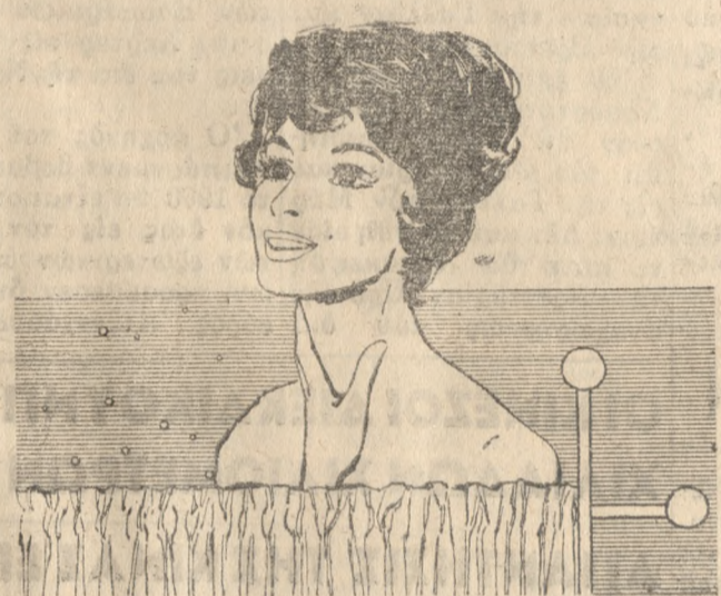
ΜΙΑ ΝΕΑ ΚΑΤΑΚΤΗΣΙΣ

ΠΩΛΕΙΤΑΙ οικόπεδο 12 μέτρα πρός εις κεντρικόν σημείον της Λεωφόρου 62 μάρτυρων (στάσις Λυρατζακή). Πληροφωρία Παύλου Σαρτζετακήν κατοικούντα εις τό ίδιον μέρος.