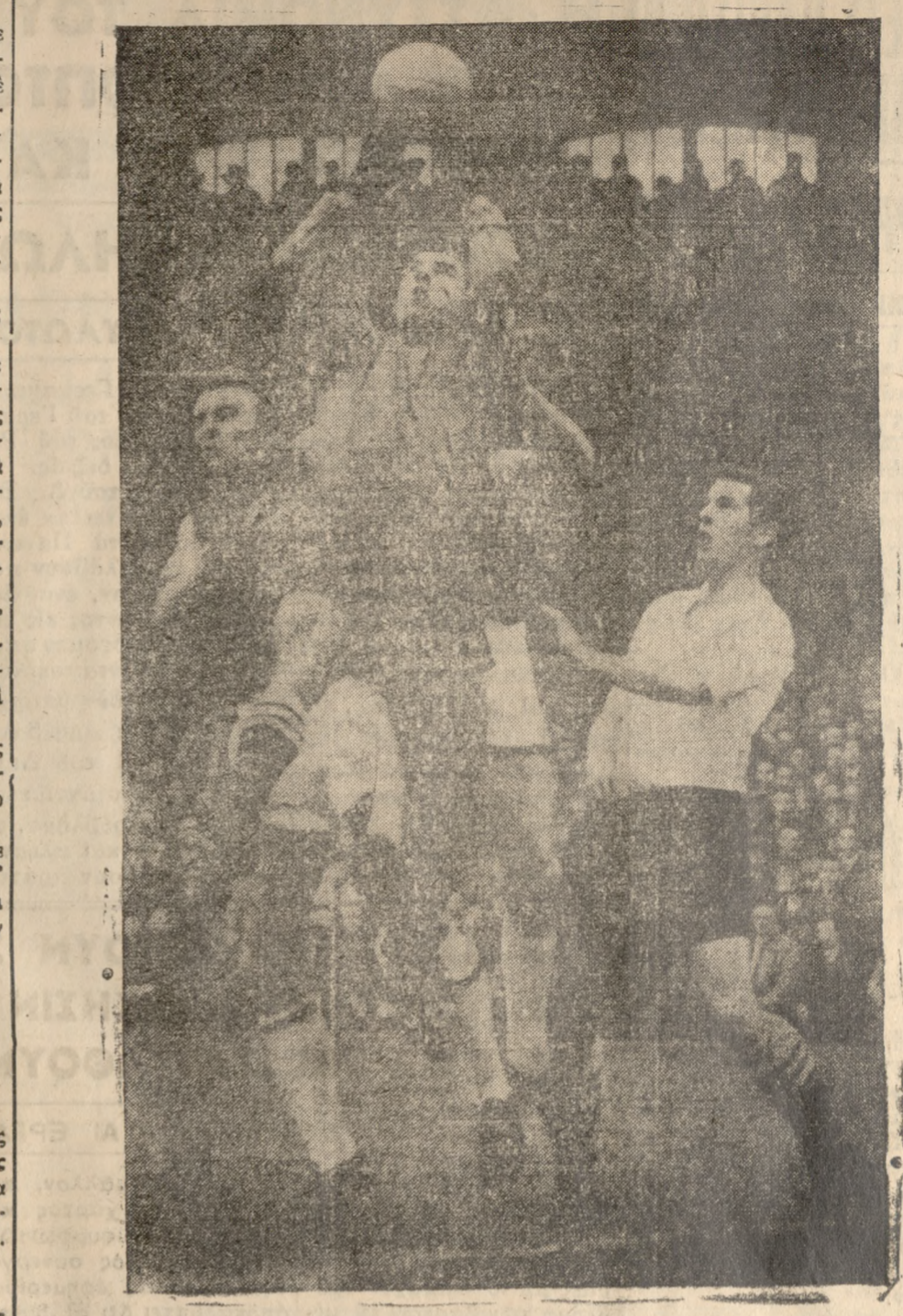
Δύο ἀπὸ τὰς ποδοσφαιρικὰς ὁμάδας τοῦ Λονδίνου, αἱ ὁποῖαι διεκδικοῦν τὸ Πρωτάθλημα Πρώτης Κατηγορίας τῆς Ποδοσφαιρικῆς Ἐνώσεως ἡ ὁμάς τοῦ Φούλαμ και τοῦ Οὔεστ Χάμ—συνητήθησαν τελευταίως εἰς τὸ γήπεδον τῆς πρώτης. Νικήτρια ἀνεδείχθη ἡ ὁμάς Φούλαμ.

Ὁσὸς κ. Κατηχητᾶ, εἰς στενωπορῆσιν μετὰ τὰ ὄλγα τοῦτα ποὺ σὰς διαφωτισίσαμε, σὰς συστήνομε τὴ Μετοχῆν Σκάλα τοῦ Ροσσίνι, ἀφῆτε τὴν, ἀνεβήτε ψηλά,