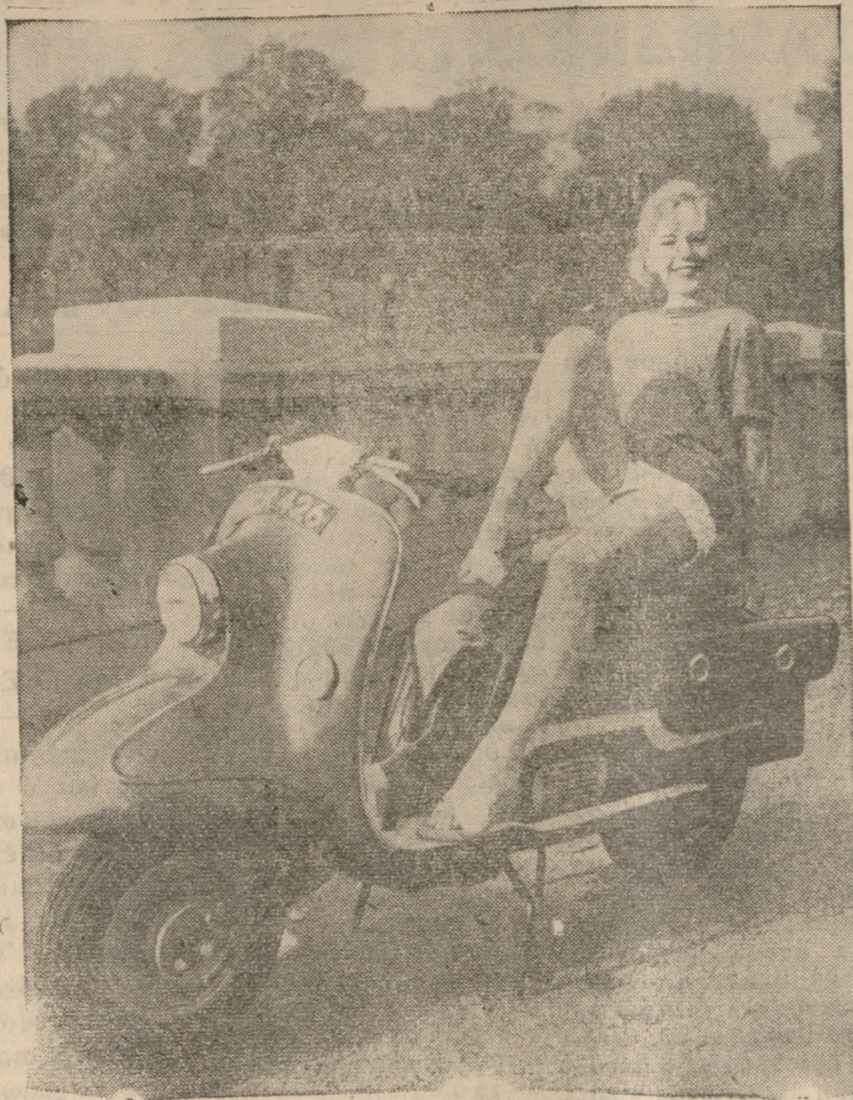
Το ανώτερο εικονιζόμενo σκούτερ είναι ένα από τα δύο νέα βρετανικά μοντέλα...