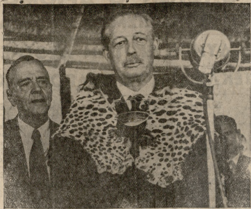
Μία εικόνα του κ. Μακμίλλαν φέροντος το ζήτημα των τετρατάκτων... προέβλεπε κατά την διάρκεια της επίσκεψής του...

ΑΠΟ ΤΗΝ ΠΕΡΙΟΔΕΙΑΝ ΤΟΥ ΒΡΕΤΤΑΝΟΥ ΠΡΩΘ ΥΠΟΥΡΓΟΥ