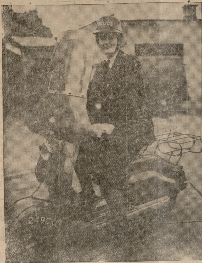
Είς τὰς ἀγροτικές περιοχές τῆς Μεγ. Βρετανίας θὰ περιπολοῦν προσεχῶς διὰ παραβάσεις ταχύτητας γυναίκες αστυνομικοὶ με μοτοσκούτερ.