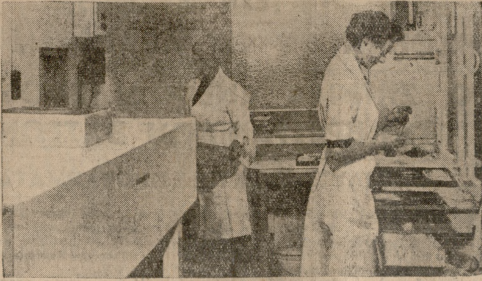
Εις τή Νοσοκομείον Σάλφωρδ της βορειοδυτικής Άγγλιας έτοιποθετήθη τελευταίως συσκευή προς ένα εύρο πρόγραμμα έκουχρονισμο ή έα αυτή αυτόματος συσκευή άποστερώσεως σφύγγων. Η συσκευή άποστερώνει 300 σφύγγες μετρίου μεγέθους ή 600 μικρού μεγέθους τήν ώρην.