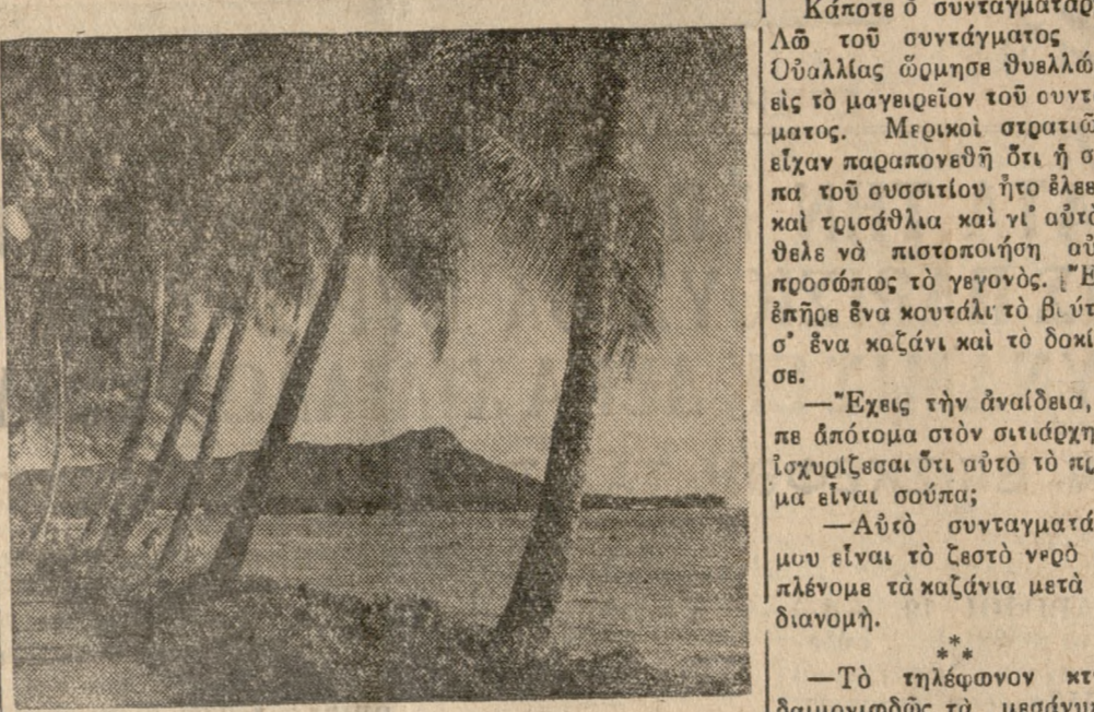
Ἡ περιήρημ ἀτὴ «Οὐάτικη», πὸν περιβάλλεται ἀπὸ φοινίκας, βροῦεται σὶν πρῶτῆς ὕψους τῆς Χαράβης Χονοαλοῦ, ἐπὶ τῆς ἡρῶν Ὀάγου. Ἡ ἐν λογφ περιήρημ βροῦει τροπικὸν δένδρον και ὀφῶν, λόγφ δὲ τὸ ἡλιου κλίματος τῆς. Οἱ φοινίκες καλλὰ ἐς τὸν τόπου ὀρβῶν πολλοὺς ἐπισκέπτας σὶν Χαράβ' ἀπὸ τότε πὸν ἀνεκαλύθησαν τὰ νησιὰτὰ ὑπὸ τοῦ Βρεταννοῦ ἐξερῶν νητο πλοίαρχου Τζέμς Κούκ, τὸ 1778.