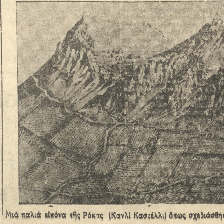
Μία παλιά εικόνα τής Ρόκας (Κανλι Καστέλλι) όπως σχεδιάσθη από τόν ΒΑΣΙΛΙΚΑΤΑ στα 1615.

γών ως είναι ή 'Ελλάς συνειδησίας άπο τής δυνατότητας τής έγκαίρου και πληροστέρας ένταξέως τής εις ένα εκ τών ύπο διαμόρφωσιν μεγαλυτέρων οικονομικών χώρων και με τας προς τούτο θέσεις υπό τας