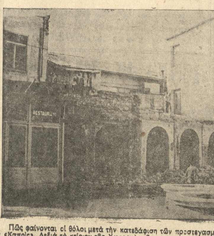
Πᾶς φαίνεται οἱ θάλοιοι μετὰ τὴν καταδαφίαν τῶν προσιταγασμάτων. Ἀριστερὰ τὸ ἐπιπέδιον καστρόπορτας, δεξιὰ τὸ κτίριον τῆς Χωροφυλακῆς.