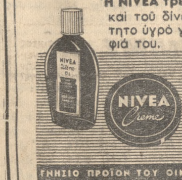
ΓΗΝΙΟ ΠΡΟΪΟΝ ΤΟΥ ΟΙΚΟΥ ΒΕΙΕΡΣΔΟΡΦ, ΓΕΡΜΑΝΙΑΣ