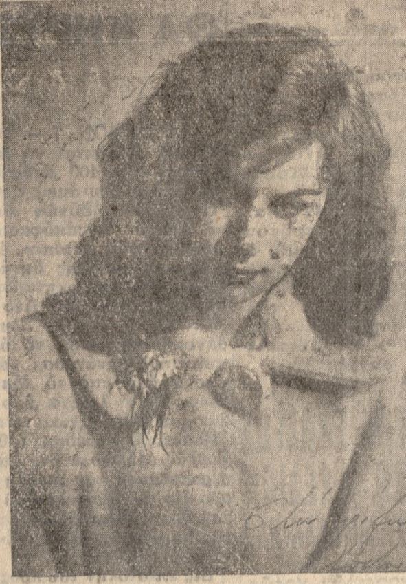
'Η ΑΛΙΚΗ ΒΟΥΓΙΟΥΚΛΑΚΗ κατὰ φωτογραφίαν ληφθεῖσα τὸ 1958 εἰς Ήρακλειον