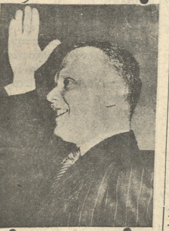
Ο κ. Σ. ΒΕΝΙΖΕΛΟΣ

Ο Αρχηγός της ΕΡΕ, εις τό κείμενον του λόγου του