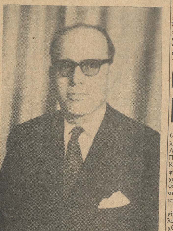
ΕΜΜΑΝΟΥΗΛ Μ. ΚΟΦΑΡΗΣ ΔΙΚΗΓΟΡΟΣ-ΤΕΩΣ ΥΠΟΥΡΓΟΣ ΥΠΟΨΗΦΙΟΣ Ε. ΚΕΝΤΡΟΥ Ν. ΛΑΣΘΙΟΥ