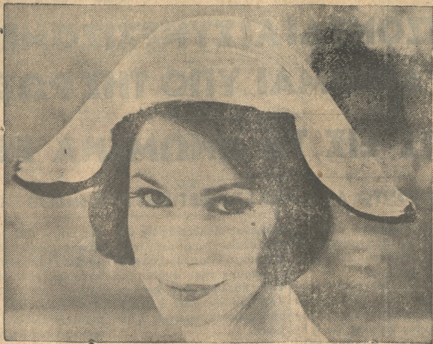
Είς μίαν επίδειξιν φθινοπωρινών και χειμερινών γυναικείων καπέλων, που έγινε τελευταίως εις τὸ Λονδίον, έκαμε τὴν εμφάνισίν του και ένα από σατέν πλισέ και μαύρο βελούδο, που ένδυμίζει πολύ τὸ γνωστὸ καπέλο τοῦ Ναπολέοντος.