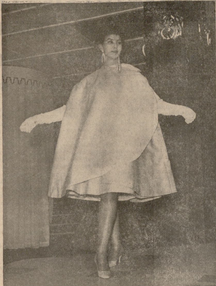
Τό ασυνήθιστο αυτό επανοφόρι—κάπα ήτο ένα από τὰ πολλὰ ἐπιδειχθέντα κατὰ τὴν Ἑβδομάδῃ Μόδας τοῦ Λονδίνου, ὅπου ἐπέδειξαν τὰ προιόντα του οἱ μεγαλύτεροι κατασκευασταὶ ἐτοιμῶν ἐνδυμάτων τῆς Βρετανίας.