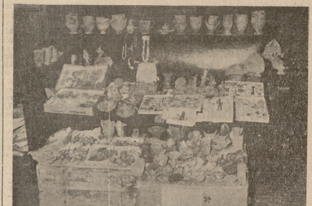
Τὰ κατασχεθέντα εἰς χείρας τῆς σπείρας ἀρχαιοκαπήλων μεγάλης ἀξίας ἀρχαιολογικὰ εὐρήματα τὰ ὁποῖα μετεφέρθησαν εἰς τὸ Τμήμα Ἀσφαλείας Ήρακλειοῦ καὶ θὰ παραδοθῶν εἰς τὴν Ἀρχαιολογικὴν Ὑπηρεσίαν.