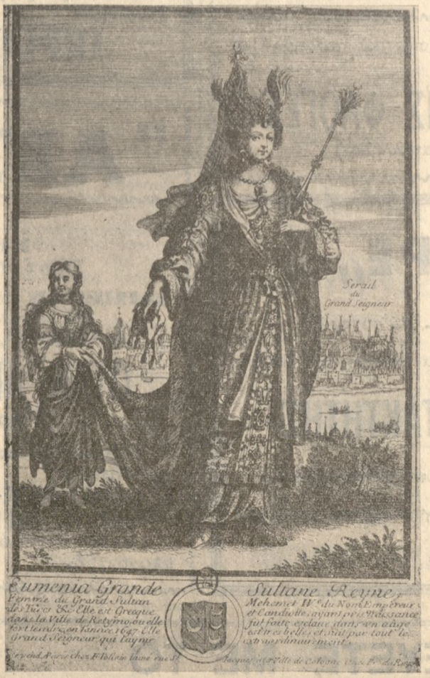
Η ΕΥΜΕΝΙΑ ΡΕΜΠΙΑ ΓΚΙΟΥΛΑΝΟΥΣ κατὰ χαλκογραφίαν τῆς ἐποχῆς

τῶν ἀδελφῶν τῶν Ἰμπραχίμ; Ἀδελφοὶ οἱ μαυρὸς σκῆφους τριγυρίζαν μέσα στὸ μυαλό