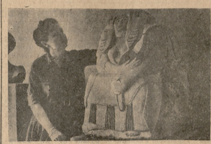
Ἡ καλλιτέχνις μὲ τὸ ἔργον τῆς «Σαπφῶν»

θ ἡ ν α ὡ δημοσιεύοντας τότε δταν τῆρεε στὴν Ἑλλάδα γιὰ τὸ ἔργο τῆς. Ἀπὸ τὸ χαρακτηριστικὸν ἄγαλμα τῆς μεγάλης λογιῆς ποιητρίης ἔχει ἐκτελεσθῆ ἀπὸ τὴν μεγάλην καλλιτέχνιδα Mrs Harriette Forbes-Oliver. Μεταφέρθη εἰς τὴν Ἑλλάδα μὲ τὸ «S.S. Queen Frederica of the National Hellenic line» καί τώρα ἀναπαύεται εἰς τὴν Μυτιλήνην. Ὁ κόσμος τῆς Μυτιλήνης εἶναι ἐνθουσιασμένος ἀντιμεσῶντας τὴν διάσημον ἀμφολυτῶν καί εἶναι ἐνθουσιωμένος πρὸς τὴν καλλιτέχνιδα πῶδ συνέλαβεν τὸ πνεῦμα τῆς μεγάλης λογιῆς ποιητρίης εἰς τὴν ἔργασίαν τῆς.