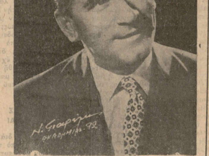
Ο δημοφιλής κωμικός ΚΩΣΤΑΣ ΧΑΤΖΗΧΡΗΣΤΟΣ