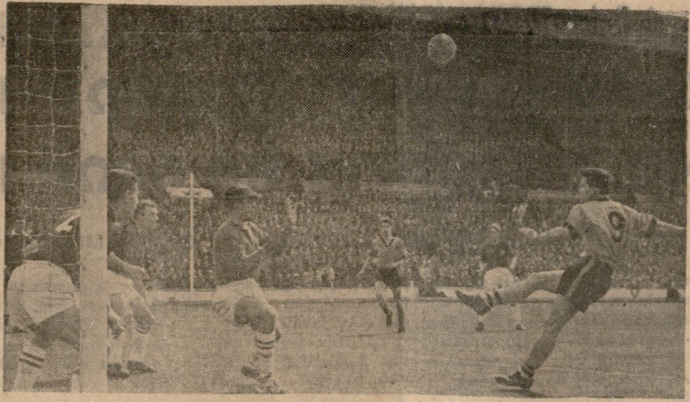
Μία φάση του ποδοσφαιρικού αγώνος των έρασιτεχνικών ομάδων Κρουκ Τάουν του Ντέραμ και Χάουουαλ Τάουν του Λονδίνου, ό οποίος έληξε με ίσοπαλία (1-1).