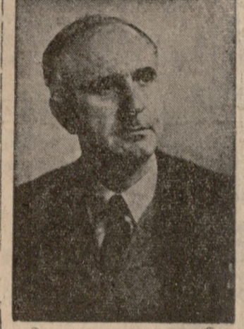
Ο Κ. ΠΑΠΑΝΔΡΕΟΥ