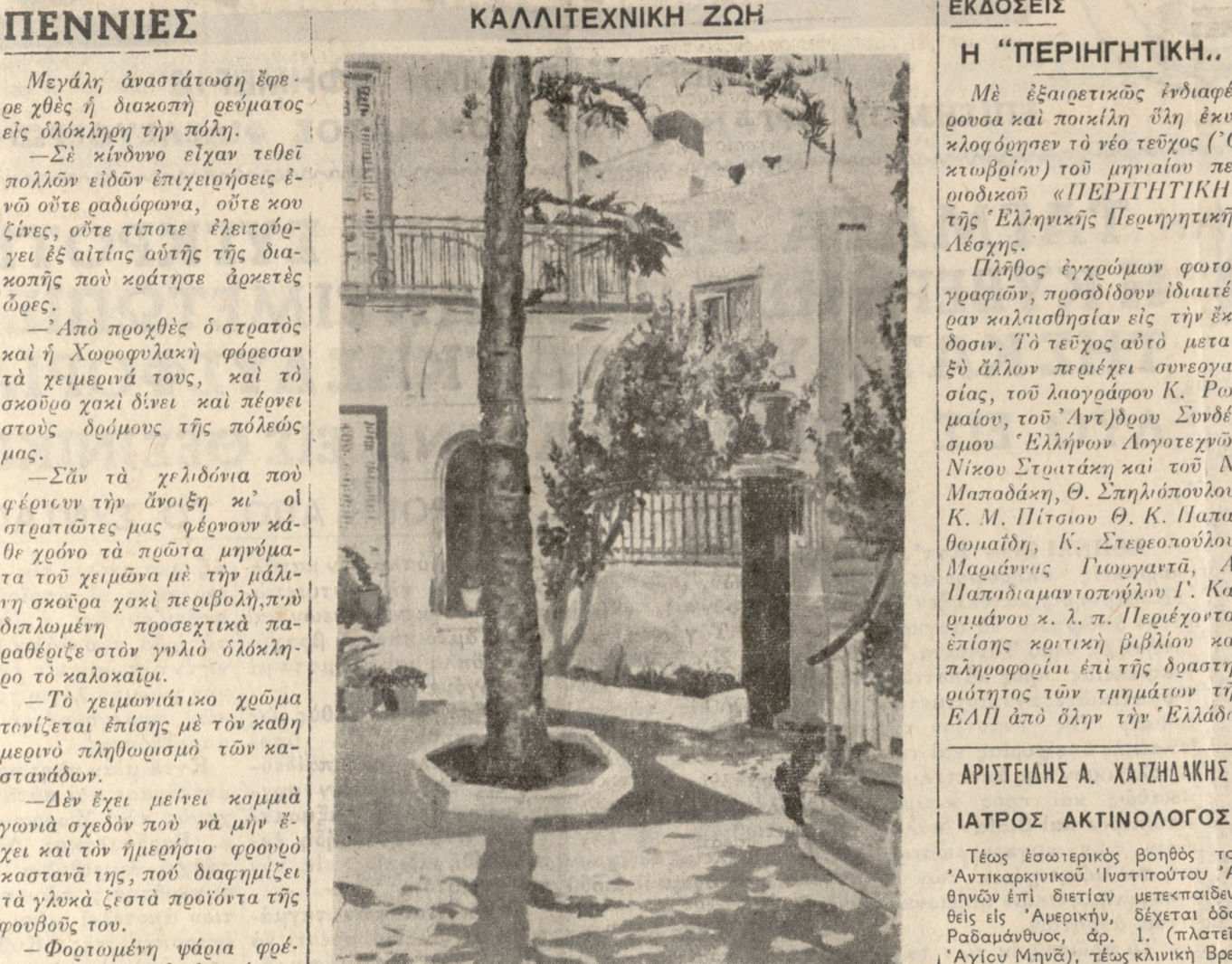
Η ΑΡΟΚΑΡΙΑ (λάδη)

«Ένα από τα χαρακτηριστικά Ηρακλειώτικα θέματα που θα παρουσιασθούν στην έκθεση του 60 συμπόλιτης ζωγράφου Γιώργου Θ. Γεωργιάδη και η οποία ανοίγει στις 27 τρέχοντες στις αίθουσες της Λέσχης «Ο Θεοτοκόπουλος».