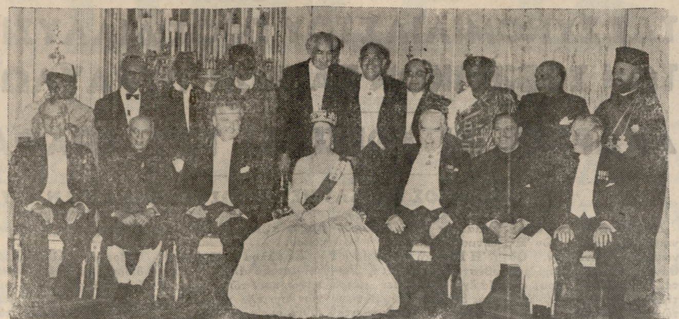
Η βασίλισσα της Άγγλιας Έλισάβετ μετά των Πρωθυπουργών της Κοινοπολιτείας κατά την πρόσφατον Διάσκεψιν, εις τήν Ήρακλειώ. Ορθοί εξ άριστερών προς τήν δεξιά: Ρασίντι Καβάβα Τανγκανίκα, Έρικ Ουίλιαμς Τρινιδάδ και Τομπάγκο, Σέρ Μίλτον Μάργκεν Σιέρραλέων, Σέρ Άμπουμπακάρ Ταφάβα Μπαλέβα Νιγηρία, Σέρ Άλεξάντερ Μπουσταμάντε Ζαμπάια, Σέρ Ρόυ Βελέσκου Ρουσία και Νουσαλάνδη, Τόν Άμπντούλ Ραζάκ Μαλάγια, Φ. Γκόκα ύπουργός Οικονομικών Γκάνα, Σ. Φερνάντο ύπουργός Δικαιοσύνης Κεϋλάνη, Άρχιεπίσκοπος Μακάριος Πρόεδρος της Κύπρου. Καθήμενοι εξ άριστερών προς τήν δεξιά: Κέϊθ Κολουά Νέα Ζηλανδία, Γιαβαχαράλ Νεχρού Ίνδία, Τζών Ντρεφενμπαίκερ Καναδάς, Ρόμπερτ Μένεντς Αυστραλία, στρατάρχης Μοχάμεντ Άγιούτ Χάν Πρόεδρος του Πακιστάν, Χάρολντ Μακμίλλαν Πρωθυπουργός Βρετανίας.