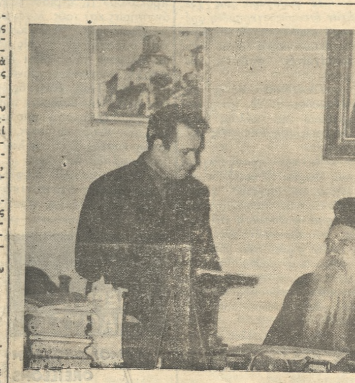
Η Α.Θ.Π. ο Οικουμενικός Πατριάρχης κ.κ. 'Αθηναγόρας δίδων την συνέντευξιν του προς τον άπεσταλμένο της «Πατρίδος» κ. Μάνον Χάρην, εις το Πατριαρχικόν Γραφείον.

Πρός Την Αύτου Παναγιότητα Οικουμενικόν Πατριάρχην κ.κ. 'Αθηναγόραν ΚΩΝ/ΠΙΟΛΙΝ Παναγιώτατε, Μετ' εϋλαβίας και προσοχής έλάβουμ γνώσιν του ύπ' άρ.β. Πρωτ. 966 έγγραφου της 'Υμετέρας Παναγιότητος προς ήμιας και το Συμβούλιον της ήμετέρας 'Ενωσεως Γεωργικόν Συνόμιον 'Ηρακλείου. 'Υποχρέωσιν θεωρούμεν όπως ύποβόλιωμεν τας θεομώτασ ευχαριστίας μας διά τας Πατριαρχικάς ειχάς και τας Πατριαρχικάς πληροφορίας άς παρέχετε ήμιν έπι του ύπο κρίσιν θέματος της 'Εκκλησίας Κρήτης. Αισθανόμεθα και ως εδωσέμε πόλιμον της 'Εκκλησίας και ως πολυπληθής παραγωγική τάξις, σεβασμόν εις τας κελύματα της μητρος 'Εκκλησίας και έχόμεθα στερεώς τών Ιερών κανόνων και παραδδσεων άς έκλήροδθησιν ως Ιερών παρακαταθήκην ή χειλιών.