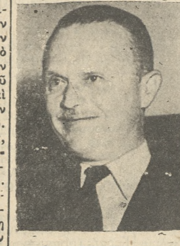
Ο κ. ΒΕΝΙΖΕΛΟΣ

«Πο έλαθών θρίαμβος, «Όλοι βεβαιώνουν ότι ούδέποτε άλλοτε υπήρχε τόσο πλῆθος εις τάς συγκεντρώσεις και τόσο πάθος εις τάς εκδηλώσεις του λαού της Ηλείας. Του είμαι ευγνώμων.»