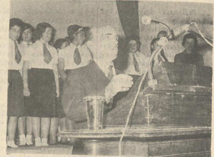
Το τραγουδισμένο μεγαλειό Κρήτης. Ο έμπνευσμένος όμιλος των Χανίων...