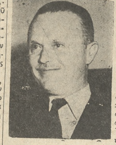
ΟΙ ΑΦΕΛΕΙΣ ΘΑ ΜΕΤΑΝΟΗΣΟΥΝ

Τής εύπρεπειας και τής καλής πίστεως ή όποια πρέπει να έμπνέ τούς άξιους του όνόματος των δημοσίων άνδρας, έν τή διεξαγωγή τών πολιτικών άγωνών.