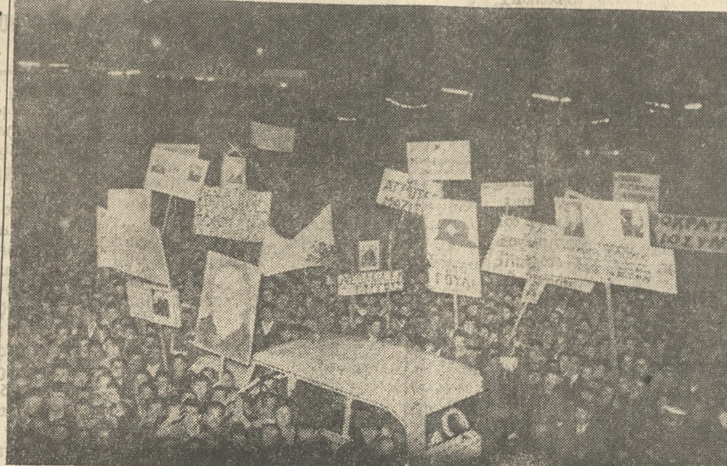
Από την χθεσινή λαοθάλασσαν η οποία κατέκλυσε την πλατεία «Ελευθερίας»...

Ξεις της παραποιήσης και... (Φωναι «Κέντρον-Κέντρον»).