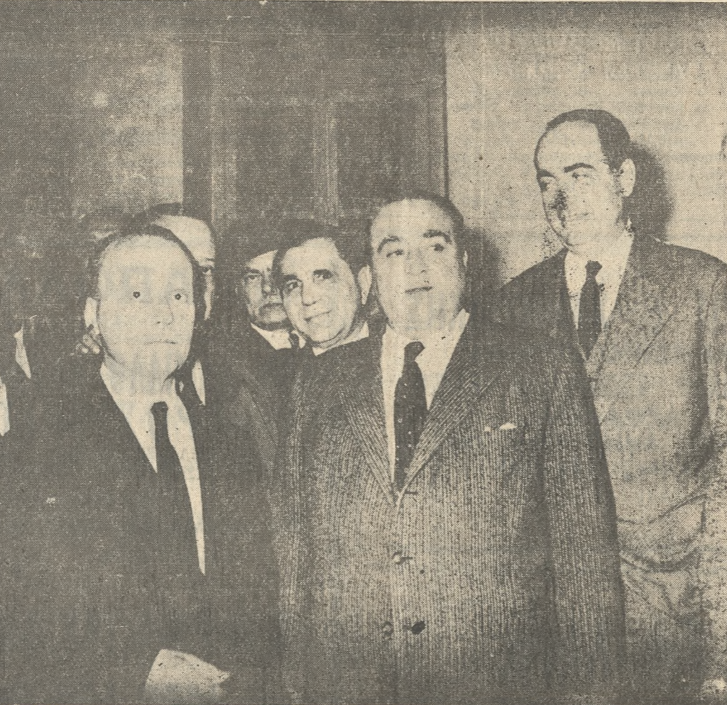
Ο άείμνηστος άρχηγός ΣΟΦΟΚΛΗΣ ΒΕΝΙΖΕΛΟΣ κατά φωτογραφίαν λη- φθεισαν προσφάτως μετά τού Βουλευτού κ. Κώστα Μαρής και τού τ. ύπουργού Οικονομικών κ. Κ. Μητσοτάκη.

Ται ταχύνω: δέν άπυ- σσασα άπό τούς Κοινοβου- λευτικούς άγώνες και κατ' επανάληψιν άπασχόλησα τώ βήμα τής βουλής διά το- πικά άλλα και διά γενικά