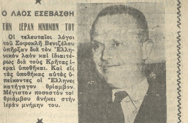
Ο ΛΑΟΣ ΕΞΕΒΑΘΗ ΤΗΝ ΙΕΡΑΝ ΜΝΗΜΗΝ ΤΟΥ Οι τελευταίοι λόγοι του Σοφοκλή Βενιζέλου υπήρξαν διά των Έλλήνων Λαών και ιδιαίτερα διά τους Κρήτες Ιερά Μνήμη. Και είν τας υποθήκας αυτές ο πεικνότες οι Έλληνες κατήγαγον θράσιν. Μέγιστον ποσοστόν τού θράσινος άνηκε στην Ιεράν μνήμη του.

ΚΑΘΗΜΕΡΙΝΗ ΠΡΩΙΝΗ ΕΦΗΜΕΡΙΣ ΕΠΙΣΗΜΟΝ ΟΡΓΑΝΟΝ ΤΟΥ ΚΟΜΜΑΤΟΣ ΦΙΛΕΛΕΥΘΕΡΩΝ