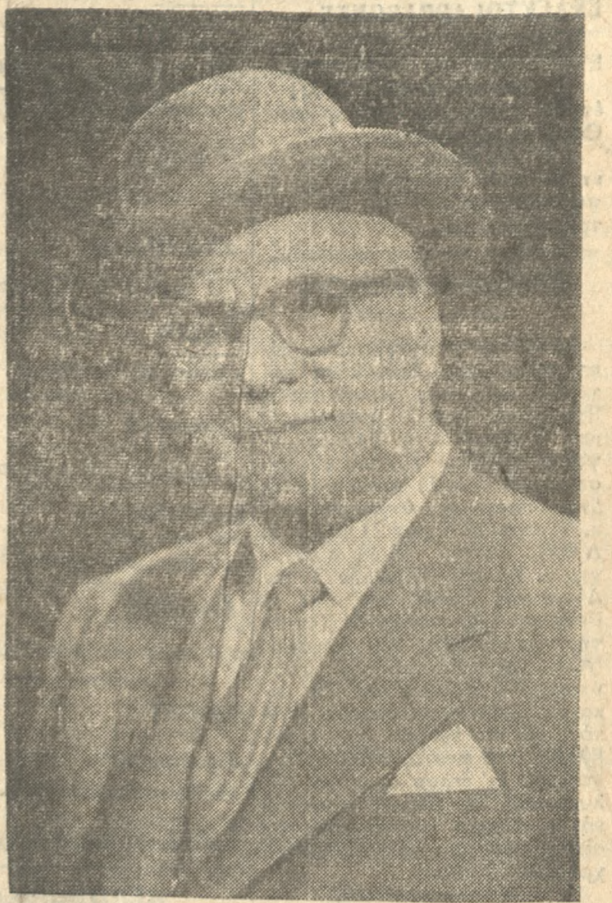
Προσέρχεται σήμερα ο λαός του Ηρακλείου εις τας κάλπας ἀπληλαγμένους ἀπὸ τὰς τοξάνες τοῦ τοῦ ἐδημιουργηθέντος ἢ προεκλογικῆς περιόδου. Μετὰ τὴν γνωστὴν εὐθυκρασίαν τὸν θά ἐκτελέσει τὸ καθῆκον τοῦ πρὸς τὴν πόλιν.