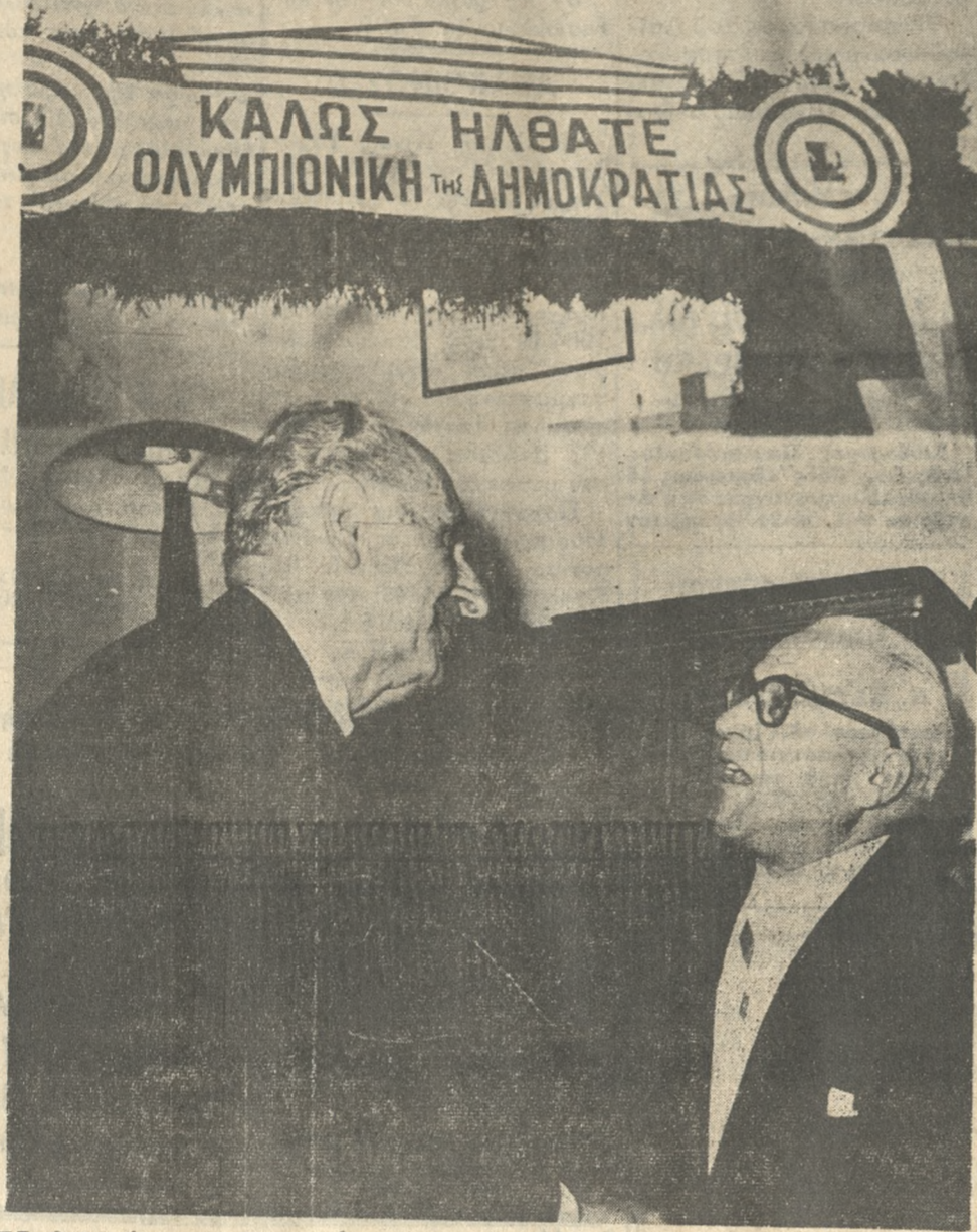
Καλὴν ἐπιτυχίαν ἠύχθη ὁ Πρόεδρος τῆς Κυβερνήσεως κ. Γεωργ. Παπανδρέου πρὸς τὸν Δήμαρχον κ. Νικ. Κρασσαδάκην, μετὰ τὴν γνωστὴν ἐγκαρδιότητα ὡς εἰκονίζεται εἰς τὴν ἀνωτέρω φωτογραφίαν.

Ἄνδρες οἱ ἄνδρες τῆς Ἑλλάδος εἶχον ὑποστῆ καθύλησιν ἀπὸ ἀπόψεως δημοτικῶν ἔργων. Ὅλοι οἱ δημόσιοι τοῦ Ἡρακλείου ὑφείλουν νὰ προσέλθουν σήμερον εἰς τὰς κάλπας καὶ νὰ ἐπανεκλέξουν τὸν κ. Νικόλαον Κρασσαδάκην διὰ νὰ τοῦ δώσουν τὴν δυνατότητα νὰ συνεχίσῃ καὶ νὰ ἐλοκληρώσῃ τὸ ὑπὲρ τῆς πόλεως δημοιουργικὸν ἔργον του. Καὶ εἶναι βέβαιον ὅτι θὰ τὸ πράξουν. Διότι ἀποτελεῖ πλέον κοινὴν πίστιν ὅτι οὗτος εἶναι ὁ μοναδικὸς σήμερον διὰ νὰ ὑψηρεθῇ καὶ πάλιν ἐπιτυχῶς τὴν πόλιν, ὅτι ἀποτελεῖ τὴν μόνον ἐγγύτητα διὰ τὸ παρὸν καὶ τὸ μέλλον τοῦ Ἡρακλείου.