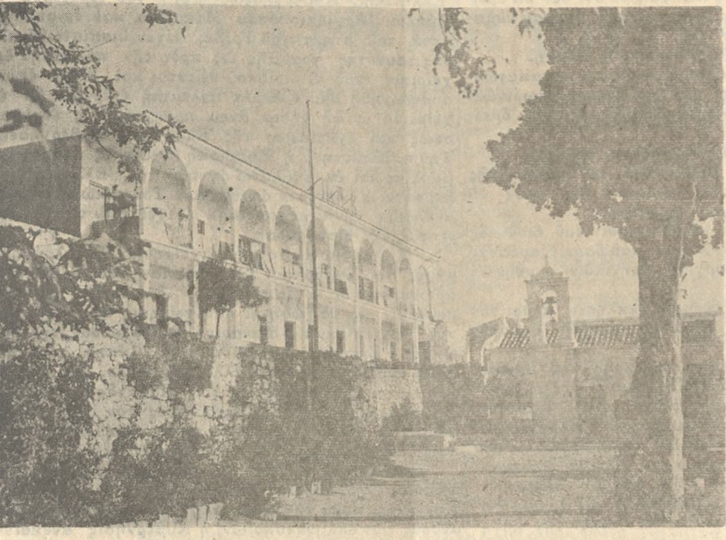
'Η Παιδόπολις 'Αγιου Γεωργίου Γοργολαΐνη