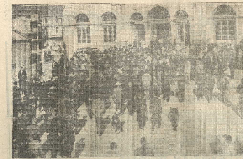
Πλήθη κόσμου συρρέουν εἰς τὸν Ἅγιο Μηνᾶ, διὰ τὸ ὕστατον χαιρῆ.