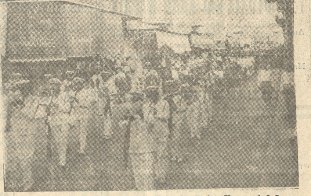
Ἡ Δημοτικὴ Μπάντα ὑπογραμμίζει τὸν μεγάλο Καστρινὸ θρῆνον.

ὡς ἐκπρόσωποι τῶν παραγωγικῶν τάξεων, οἱ διευθυνταὶ καὶ συντάκται τῶν ἡμερησίων καὶ ἑβδομαδιασίων ἐφημερίδων, καὶ πλῆθος ἄλλων ἀνθρώπων πάσης τάξεως ἡλικίας καὶ φύλου. Ἡ νεκρικὴ πομπὴ διὰ τῶν οἰκείων, Πλατείας Κύπρου, Ἐβαν, Λεωφόρου