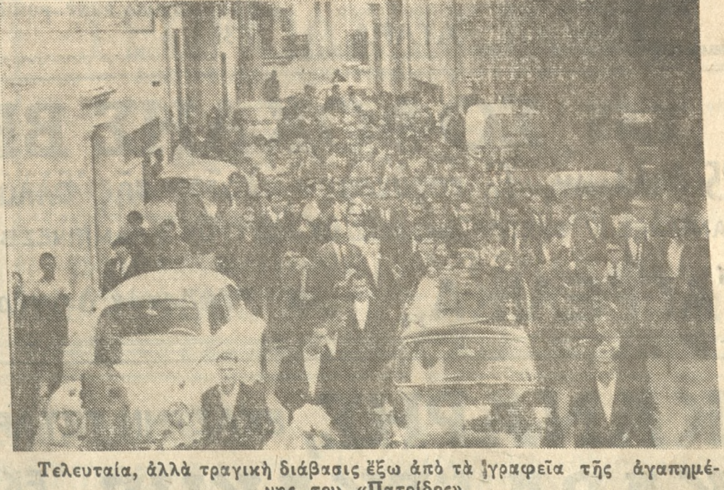
Τελευταία, ἀλλὰ τραγικὴ διάβασις ἔξω ἀπὸ τὰ ἱεροφύλακα τῆς ἀγαπημένης του «Πατρίδος»

πτέρυγα μετὰ τῶν ἱερέων Καλοκαιρινοῦ καὶ Ἁγίου καὶ ἦσαν οὕτως πυκνὴν οἰκοδομήν ὡς ἀντιζυγίαν οἱ φέροντες τὰ στέφανον, ἐν συνεχείᾳ δὲ αὐτῶν καὶ πρὸ τοῦ φερέτρου προηγεῖτο τὸ ἐργατικὸν καὶ ὑπαλληλικὸν προσωπικὸν τῆς πατρίδος μὲ ὀγκώδεις πολύχρωμες ἀνθοδέσμες. Ὅπισθεν τοῦ φερέτρου, (Συνέχεια εἰς τὴν 4ην σελίδα)