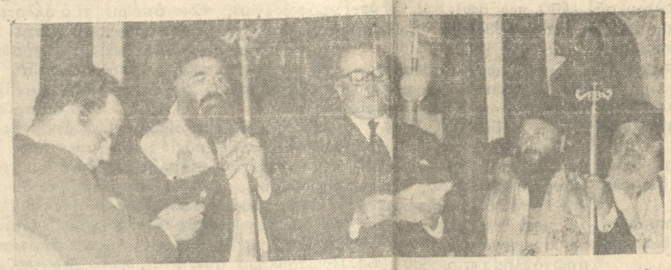
«...Ἡ Ἐνωσις Κέντρου καὶ ὁ ἀρχηγός της δι' ἐμοῦ στέλλουν τὸν τελευταῖον χαιρετισμὸν πρὸς ἐσὲ τὸν ἀγνὸν ἀγωνιστὴν τῆς ἰδεολογίας μας».