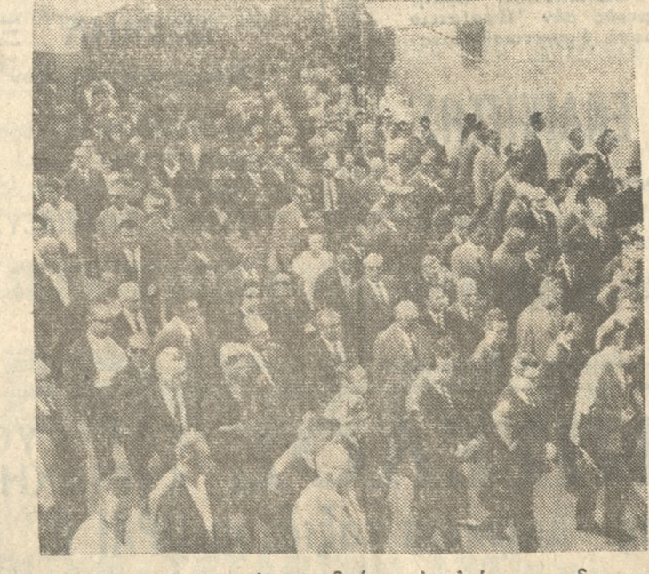
Ἡ νεκρικὴ πομπὴ συνοδεύει τὸν αἰμῆνστο διευθυντήμας στὴν τελευταία του κατοικία.

πτέρυγα μετὰ τῶν ἱερέων Καλοκαιρινοῦ καὶ Ἁγίου καὶ ἦσαν οὕτως πυκνὴν οἰκοδομήν ὡς ἀντιζυγίαν οἱ φέροντες τὰ στέφανον, ἐν συνεχείᾳ δὲ αὐτῶν καὶ πρὸ τοῦ φερέτρου προηγεῖτο τὸ ἐργατικὸν καὶ ὑπαλληλικὸν προσωπικὸν τῆς πατρίδος μὲ ὀγκώδεις πολύχρωμες ἀνθοδέσμες. Ὅπισθεν τοῦ φερέτρου, (Συνέχεια εἰς τὴν 4ην σελίδα)