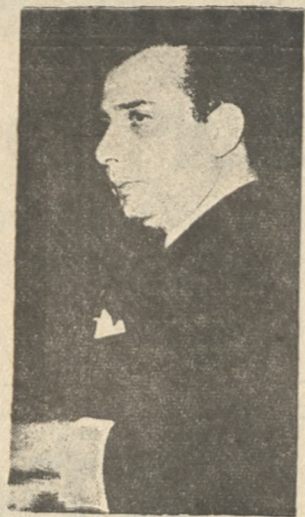
Ο κ. Σ. ΚΥΠΡΙΑΝΟΥ τήν θείαν εις τήν όπιαν εύρισκετο τό Κυπριακό κατά τόν Δεκέμβριον τού 1963 και τούς πρώτους μήνας τού 1964 άποδεικνύον ασφώς τήν όρθότητα τής πολιτικής ταύτης. Ο κ. ύπουργός εξέφρα-

ΔΕΥΚΩΣΙΑ 31.— Ο υπουργός εξωτερικών της Κυπριακής Δημοκρατίας κ. Σπύρος Κυπριανού εξέθεσε σήμερον ενώπιον της βουλής των αντιπροσώπων την πολιτικήν της Κυβερνήσεως επί του Κυπριακού ζητήματος εις τό διεθνές πεδόν τονίζων ότι αυτή παραμένει ακλόνητος και σταθερός η αυτή, ήτοι η δια των Ηνωμένων Έθνών εξασφαλίς άδεσμευτού ανεξαρτησίας περιεχομένης τού δικαιώματος τής αυτοδιάθεσης συμφώνως προς τας αρχάς τού καταστατικού χάρτου τού διεθνούς οργανισμού ήνα ό Κυπριακός λαός ρυθμίση ελευθέρως και άνευ άνταλλαγών τών τού μέλλοντος, συμφώνως προς τας έπιθυμίας του. Τό διαβούσαν 10 μινον επείν ό κ. Κυπριανού ό πηρξε μία τών κρισιμω-