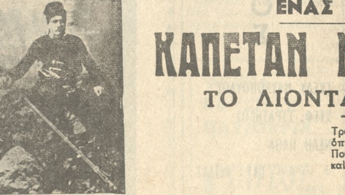
ΚΑΠΕΤΑΝ ΜΙΧΑΗΛΗΣ ΚΟΡΑΚΑΣ