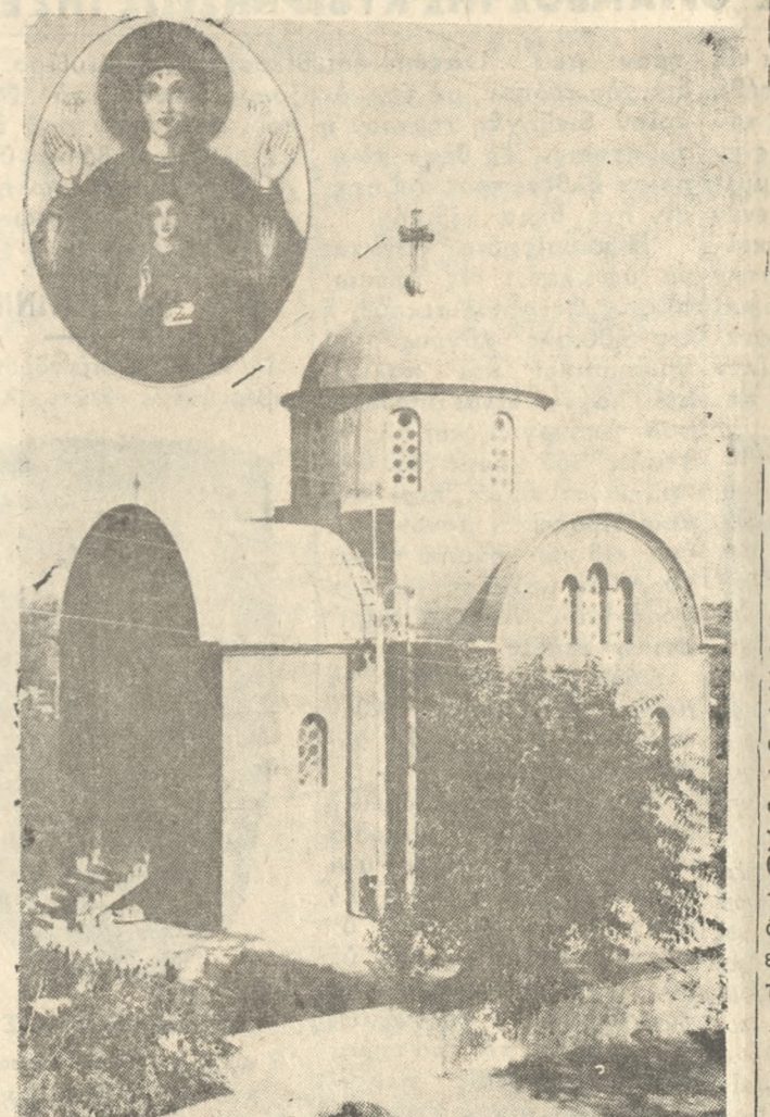
Ναὸς τῶν Εἰσοδίων τῆς Θεοτόκου.

Τὸ προσεχὲς Σάββατον 21ην Νοεμβρίου ἑ. ἑ. ἑορτὴν τῶν Εἰσοδίων τῆς Θεοτόκου ἑορτάζει ὁ Νοδμητος ἐν τῷ εὐλόγησις τῶν ἄρων καὶ ἐν συνεχεία ἡ Θεία λειτουργία, ἰεργουόντος τοῦ Πανοσιολογίου