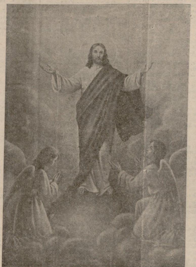
Χριστός Άνάστη εκ νεκρών

Δέν είμαστε ήμεις οι χθε- σινού του όχλου. Με την π- στη μας, με χαμόγελα πού κρέμονται στα χείλη, με ά- νοιχτή καρδιά—κάμπο χα- ράς— υποκλινόμθα στο γύ- ρισμα του ήμεροδείχτη. —Χριστός Άνάστη. —Άληθώς Άνάστη. Η άπόκριση. Άντίρρηση δέν ή πάρεσι. Η ίδια όμορφονία με έκείνη της βλοσυρής απαί- σιας προσταχτικής του εσταυ- ρωθέντος. Δέν έχει σήμερα προσταχτικές. Άγγελα Ειρήνης. Σύνθημα χαράς ή Ανάστασιν. Χθές άκόμη, ή