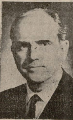
Ο κ. ΑΝΔΡ. ΠΑΠΑΝΔΡΕΟΥ

Κατά τας ύπαρχούσας πληροφορίες ό Πρωθυπουργός κ. Γ. Παπανδρέου εις την κατάληξιν από τινος χρόνου, εις τήν απόφασιν να επαναφέρη τόν υιόν του εις τήν Κυβέρνησιν, επιθυμούν να χρησιμοποιήση τήν δυναμικώτερα στελέχη τής Ένωσεως Κέντρου. Είς τούτο συνέτεινον και αι τήν ύποψιν ώς υφυπουργός προεδρίας τής κυβερνήσεως και ό μέχρι τούδε υφυπουργός προεδρίας τής κυβερνήσεως κ. Γεώργιος Μυλωνάς ως υφυπουργός εθνικής παιδείας και θρησκείας.