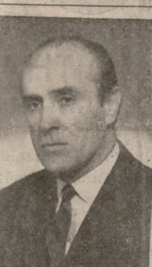
Ειδικός Σύμβουλος Προεδρίας Κυβερνήσεως

Πρώτο αντίκρουσμα με τή δυστυχία κάνει ό Σολωμός στον καθρέφτη των προσώπων του [σπινιου του. Κι όταν άργότερα θα σπάσει τά χρυσάδια εκείνου του άπαισιου οικογενειακού κατοπιρισμού και θα καταχτήσει τή θέση του στην οικογένεια, θάρθει τό πλατύτερο περιβάλλον, ή 'Ιστοική άναγέννηση τής όποια σπουδαίει, να έδραση τίς μέχρι τώρα άβέβαιες και μετώρες μέσος του έπιδρασεις. Κι ό Σολωμός, θα είναι πιά έτοιμος να διαδραματίσει—κατά τή γνώμη του όμιλητή—τό ρόλο που «ή βεία συγκυρία ή ή μοίρα τού έταξάν, να γίνη ό βάρδος τής εθνικής μας ποίησης. Έδωσέ με σίσθημα και ένάργεια έναν Σολωμό γεμάτον παλμό και πάθος, έναν τραγουδιστή τής λευτεριάς γατόν ενύγεια και φλόγα που καίει. Άσφώρημα ββαία και στην πρό τού 'Υμνου περίοδο τού λυρικού ποιητή, όν έπηρεασμένου από τόν 'Ιταλικό ρομαντισμό. Μα εκεί πού στάθηκε ββαία και έδωσε όλο τό μεγαλειό τής έκφρασης του ό κ. Συναδινός ήταν ό «'Υμνος και οίε' 'Ελευθέρου Πολιορκημένου» που δείχνομε τόν άγωνιστή ποιητή τόν 'Ελ-