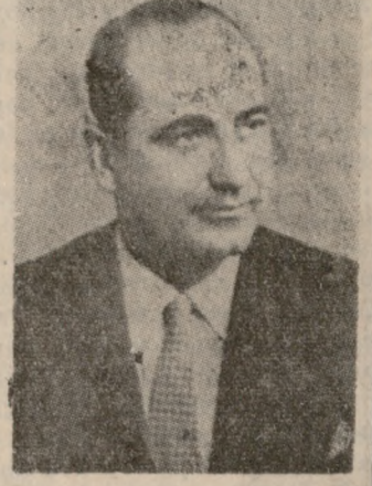
Ο Κ. Κ. ΜΗΤΣΟΤΑΚΗΣ (Ἀφικνεῖται σήμερον)

Ἡ Κρήτη περιμένει ἀπὸ σᾶς νὰ θεραπευθῆ ἀπὸ τὴν βόσσαν ἑλλείψιν ὁδοποιήσας. Καί εἰμεθα βέβαιοι ὅτι διὰ τὸς εἰς ἡμᾶς θὰ μείνῃ ἱστορικῆ.