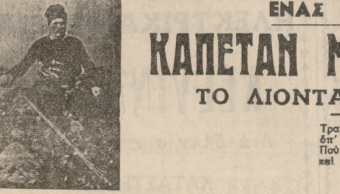
Τραγοῦδι λέν τοῦ Κόρακα τοῦ Καπετᾶν Μιχάλη

Ἐπὶ τὴν γῆσιν καὶ ἀνδρεία δὲν θὰ τοῦ μοιάσουν ἄλλοι. Πῶς τὸν φοβῆται ἡ Τουρκία, παρὸς τὸν τρομακτικὸν καὶ τουρκοφῶγο Κόρακα ὅλοι τὸν ὀνομάζουν.